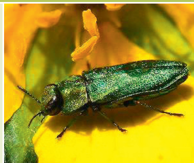
Kleiner Kirschbaum-Prachtkäfer (M)